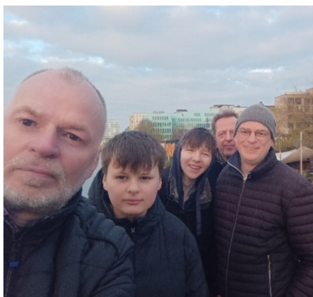
Das SKBN Team

Schnellschachturnier des Clubs mit 24 Teilnehmern (7 Runden CH, 10 Minuten + 5 Sekunden) kiebitten. Der Fußmarsch nach Kreuzberg hatte sich gelohnt und erwies sich als gelungene Einstimmung auf das Turnier.